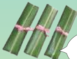
カーサームーチー